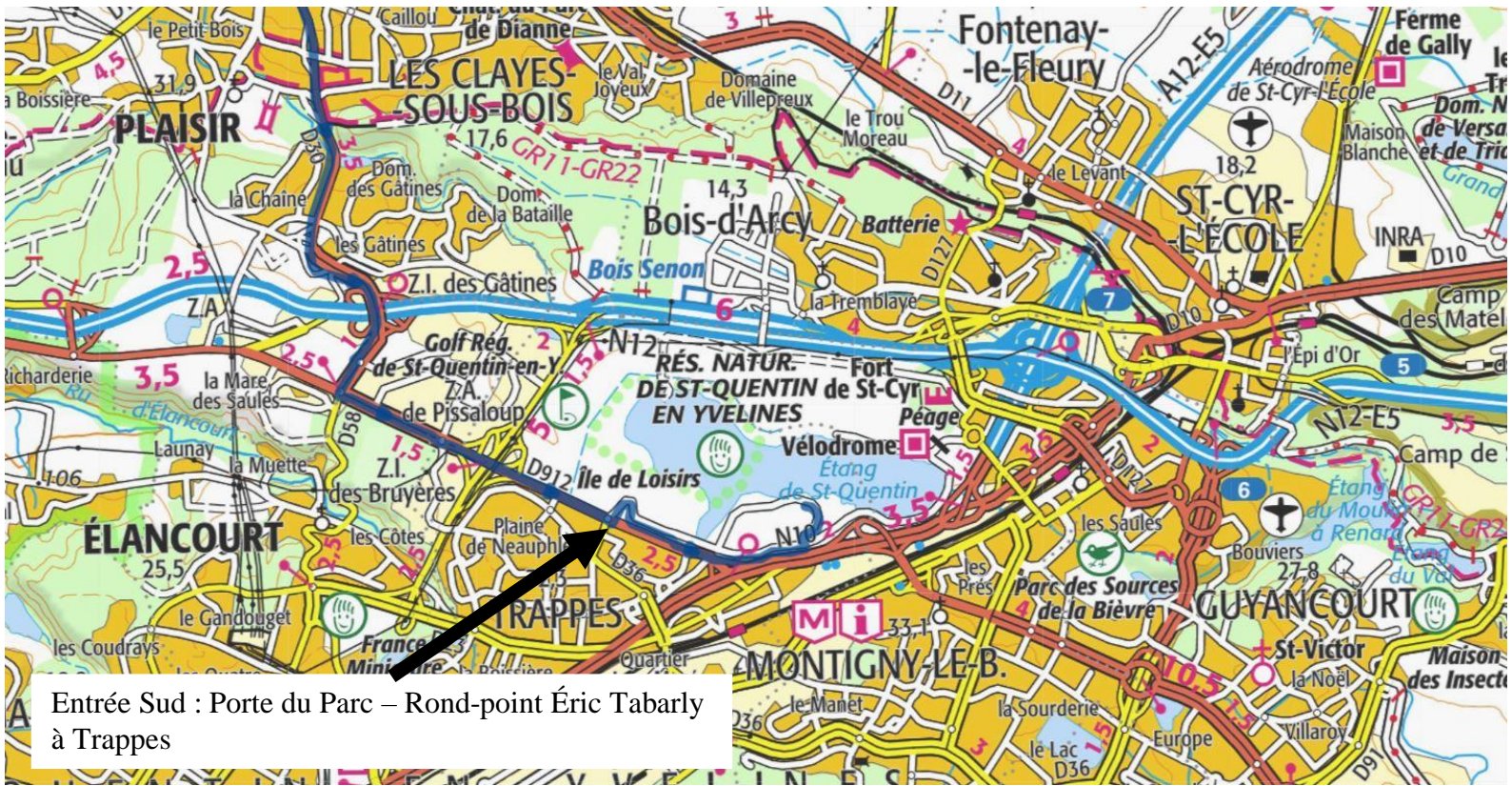
Entrée Sud : Porte du Parc – Rond-point Éric Tabarly à Trappes